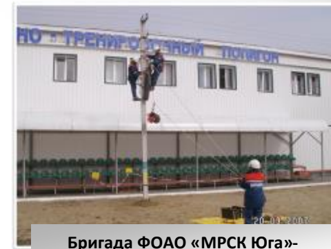
Бригада ФОО «МРСК Юга»-«Волгоградэнерго»