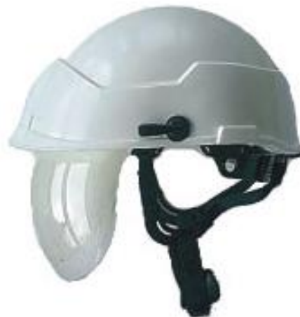
Защитный шлем с забралом