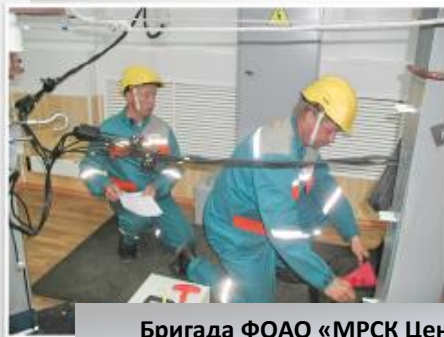
Бригада ФОО «МРСК Центра»-«Ярэнерго»

2. Результаты исследования легли в основу документа «Типовая инструкция по организации и выполнению работ под напряжением в электроустановках до 1000 В», принятого ОАО РАО «ЕЭС России» в 2008 году, а также использовались при разработке положений и инструкций при организации полигона на базе филиала «Камышинские электрические сети» ПАО «МРСК Юга Волгоградэнерго», на котором успешно осуществляется подготовка персонала для выполнения работ под напряжением.