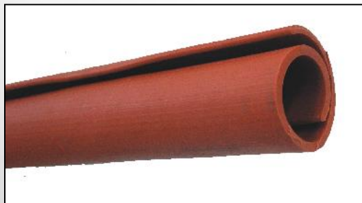
← защита на провод типа S