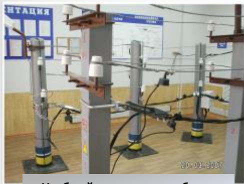
Учебный класс для отработки практических навыков

1. Разработанные методики анализа риска травмирования персонала при выполнении работ под напряжением и оценки уровня подготовки персонала повышают технологическую и экономическую эффективность выполнения работ под напряжением при одновременном снижении травматизма.