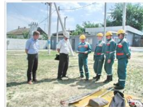
Бригада ФОО «МРСК Центра»-«Ярэнерго»