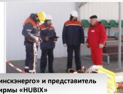
Бригада РУП «Минскэнерго» и представитель фирмы «НУВІХ»