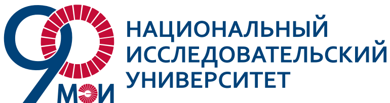
ЛОГОТИП ДЛЯ ГЛАВНОЙ СТРАНИЦЫ ПОРТАЛА

Минималистичный дизайн определяется использованием несложных фигур и четких силуэтов, обеспечивает легкость восприятия. Лаконичность элементов в простоте форм и очертаний. Благодаря активному цвету, наклону и округлой форме цифр, логотип выглядит динамичным и подвижным.