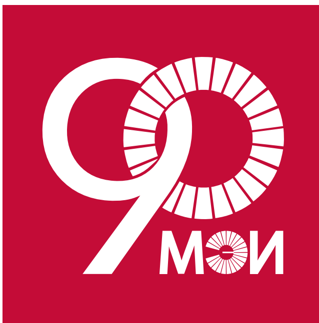
ИНВЕРСНЫЙ ВАРИАНТ ЛОГОТИПА

Инверсное изображение логотипа предусмотрено, когда необходимо разместить его на цветном сплошном или цветном неоднородном фоне. При этом весь логотип перекрашивается в белый цвет. В случае необходимости использования иных цветовых решений можно применять инверсное написание с различной интенсивностью.