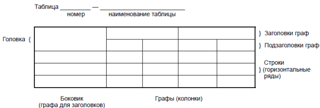
Рисунок 6.1 – Оформление таблицы

При делении таблицы на части допускается ее головку или боковик заменять соответственно номерами граф и строк. При этом нумеруют арабскими цифрами графы и (или) строки первой части таблицы. Таблица оформляется в соответствии с рисунком 6.1.