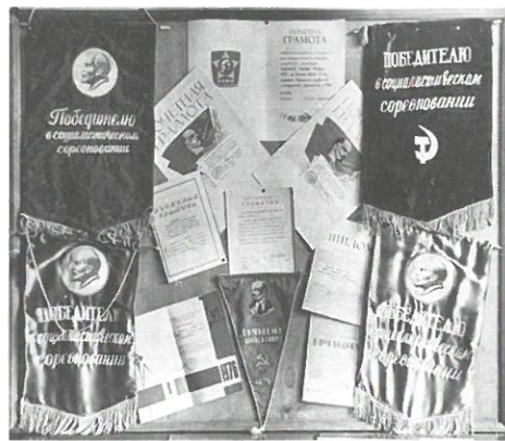
Кафедра истории КПСС неоднократно занимала первое место в соц. соревнованиях, награждалась вымпелами, почетными грамотами