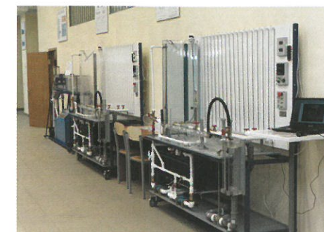
Обновленные лаборатории и аудитории ИГВИЭ

ментальный полигон возобновляемой энергетики.