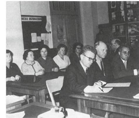
Коллектив кафедры истории КПСС. 1977 г.

В 2012, 2013 и 2014 гг. кафедра занимала 1 место в рейтинге НИУ «МЭИ» среди кафедр третьей группы. С внедрением информационной системы РУР-ПКР (СТИМ) все преподаватели кафедры являются эффективными: средний балл СТИМ каждого НПП равен или