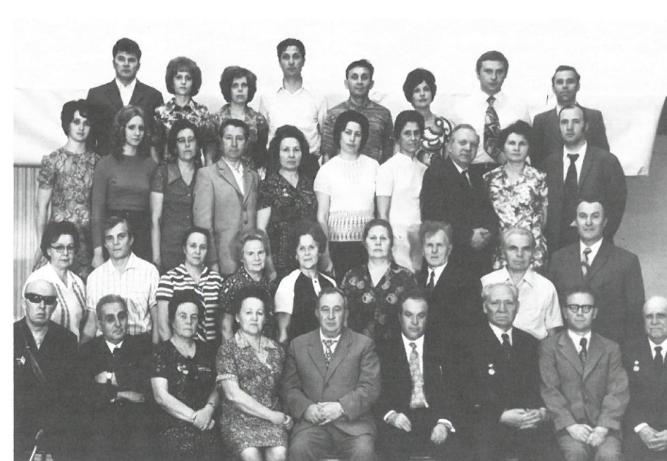
Педагогический состав кафедры истории КПСС. 1977 г.