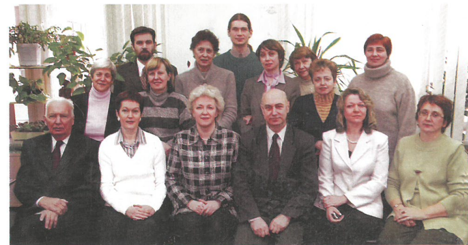
Коллектив кафедры Истории и культурологии в 2005 г.

Дисциплина «Культурология» преподается в МЭИ с 1990 г. В соответствии с рабочей программой дисциплины 2023 г. целью ее освоения является изучение основных принципов функционирования и закономерностей развития культуры как целостной системы.