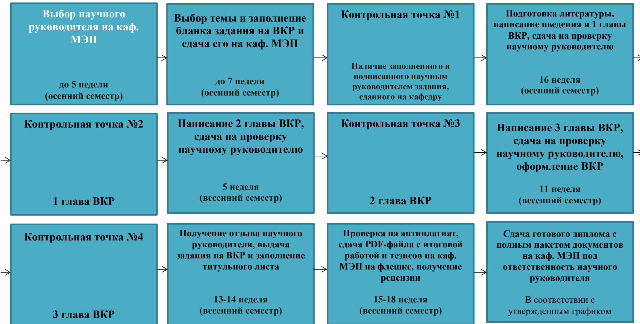
График выполнения выпускной квалификационной работы бакалавра (ВКР) ***