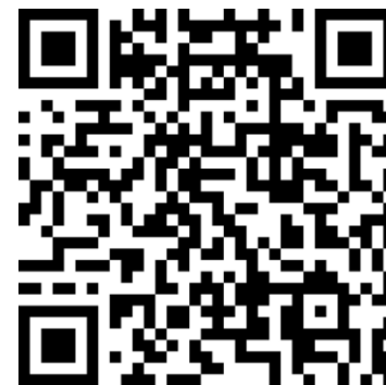
Сервис записи на приём

Используй QR-код для записи на приём в Паспортный отдел.