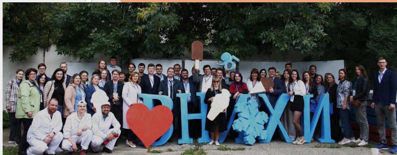
XVIII Международная научно-практическая конференция молодых учёных и специалистов «Будущее на тарелке: технологии, которые формируют индустрию», 2025 г.