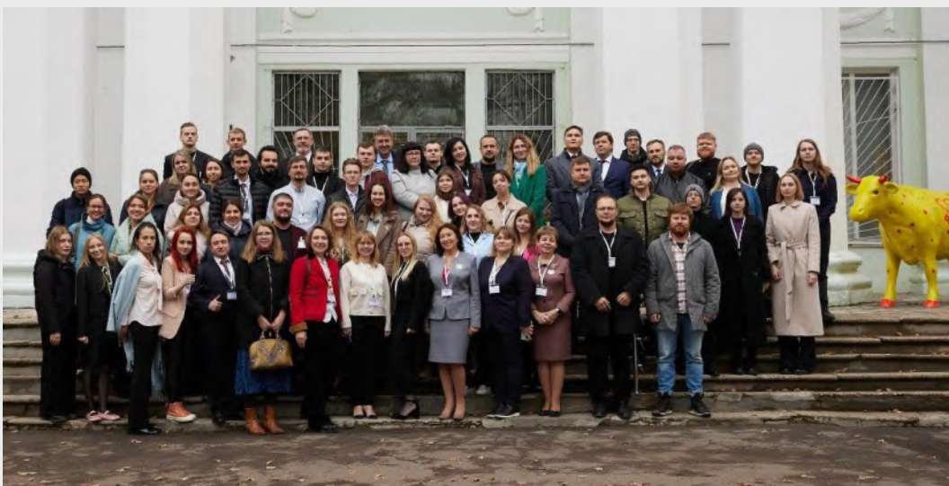
XVII Международная научно-практическая конференция молодых учёных и специалистов «Пищевые технологии будущего: инновационные идеи и научный поиск», 2024 г.

Это не просто формальные заседания, а площадка для живого диалога. Здесь молодые специалисты могут представить результаты своих исследований, получить обратную связь и, что немаловажно, найти коллег для будущих междисциплинарных проектов. Традиционно мы стараемся привлекать не только московские вузы, но и студентов из регионов, чтобы наука объединяла всю страну.